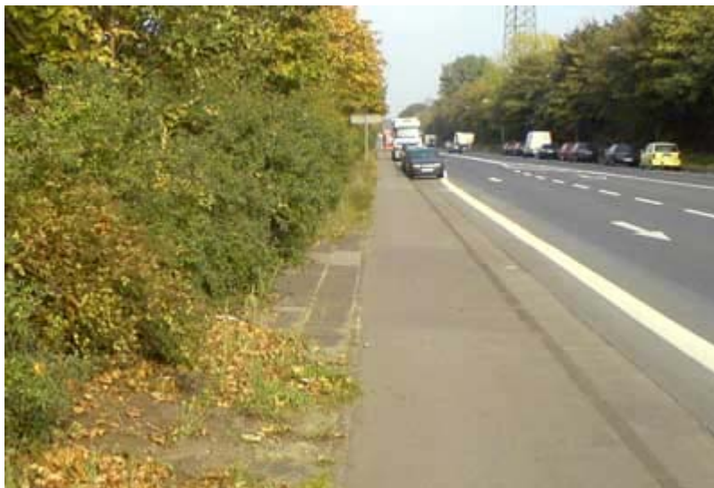
an einigen Stellen auf der Mannesmannstraße in Richtung Huckingen ist der ehemalige Bürgersteig noch zu erkennen.