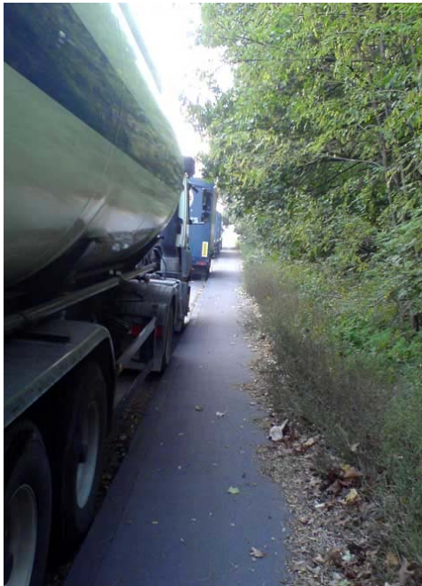
beengter Radweg im Bereich Ehingen auf der Mannesmannstraße; für Radfahrer unzumutbar und gefährlich.